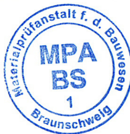
i.A. Dipl.-Ing. H. Trenkler Prüffeld CPS